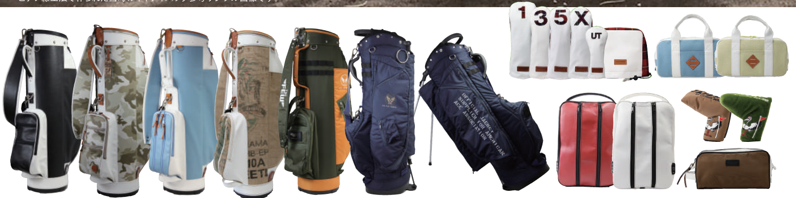
ピアノ線工法で作られた当時のキャディバッグ参考サンプル画像です。