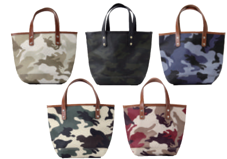
● COLOR ASSORTED