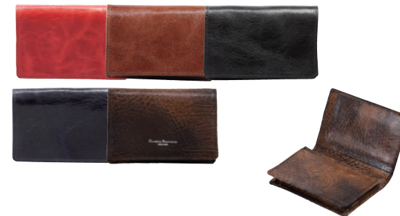
● BLACK ● BROWN