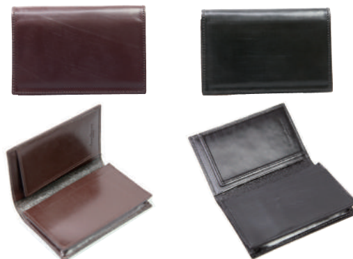
● BROWN ● BLACK