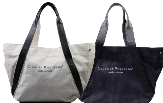
● BLACK ● BLUE

しっかりとした厚目の6号帆布を使用した、シンプルビックトートバッグ。付属革に牛革を使用しアクセントにしています。両サイドのホックで容量に合わせて形を変形することが可能。マザーズバッグとしてもご使用いただけます。