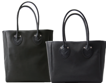
C1061 ● BLACK C1062

シンプルでどんなスタイルにも合わせやすいトートバッグ。持ち手の長さも十分にあり、肩掛けもしやすくしています。