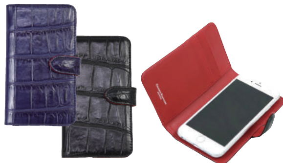
● BLUE ● BLACK