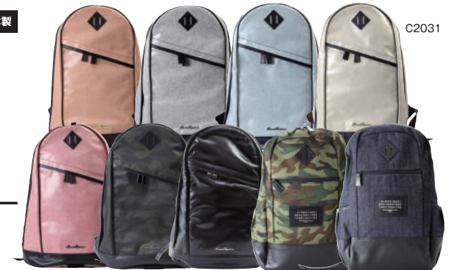
● COLOR ASSORTED