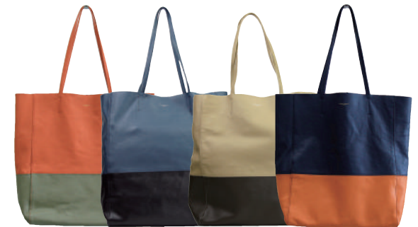
● COLOR ASSORTED