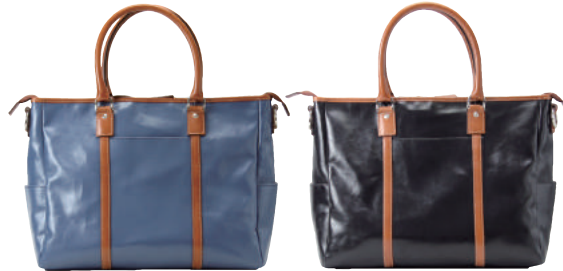
● BLUE ● BLACK