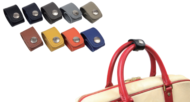
● COLOR ASSORTED