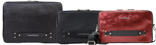
S2028 S2029 S2044

ITEM NO. S2028 / S2029 / S2044 SIZE 約39×27×5cm / S2028 約32×20×4cm / S2029 MATERIAL 本体：牛革 付属：牛革 PRICE ¥22,000 (税抜) / S2028 ¥18,000 (税抜) / S2029 ¥22,000 (税抜) / S2044