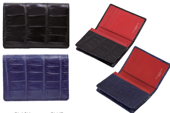
● BLACK ● BLUE