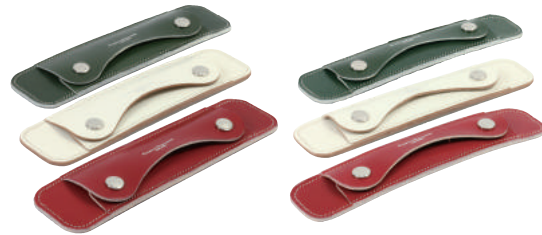
● COLOR ASSORTED