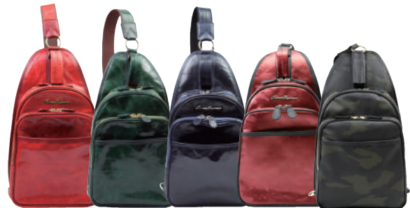
C2021 S2043 JP2007 ● RED ● GREEN ● BLUE ● RED COMO ● COMO