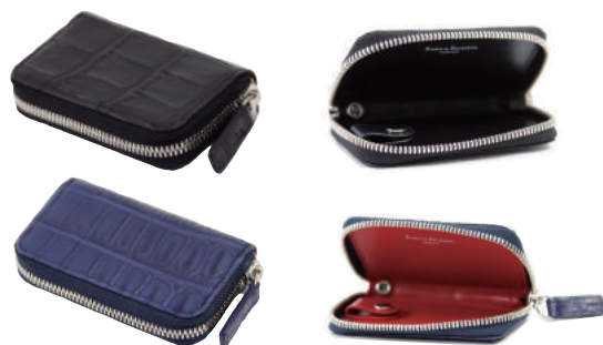
● BLACK ● BLUE