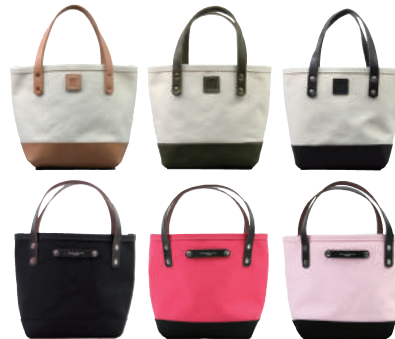
● COLOR ASSORTED

しっかりとした厚目の6号帆布を使用した、シンプルミニトートバッグ。付属革に牛革を使用しアクセントにしています。