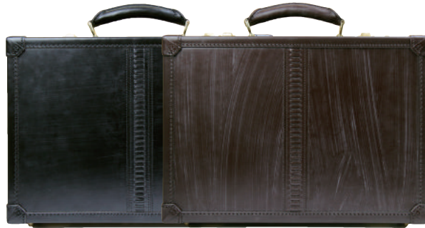
● BLACK ● BLOWN