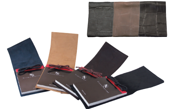
● COLOR ASSORTED