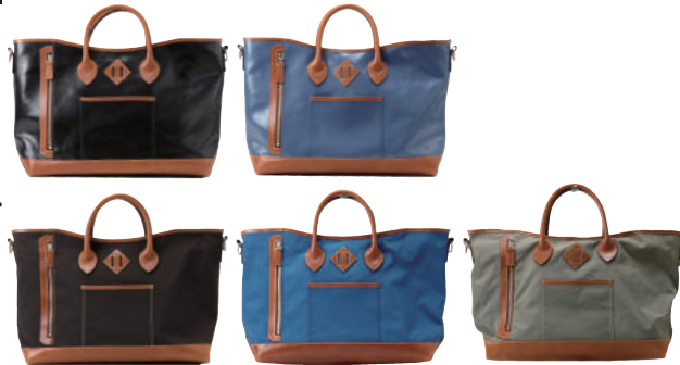
● BLACK ● BLUE ● KHAKI