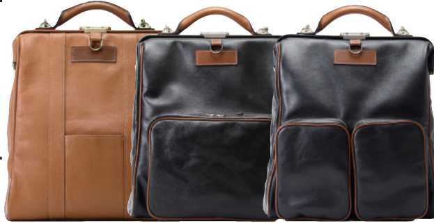
Type-A ● BLOWN Type-B ● BLACK Type-C ● BLACK