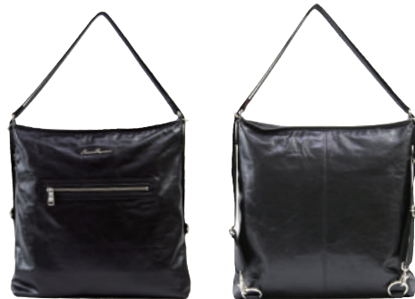
● BLACK ● BLOWN