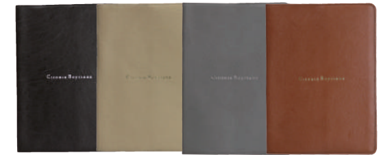
● COLOR ASSORTED