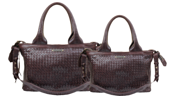
● BLACK ● BROWN

特徴的な編み込み(ウェーブ)の取手、交差(クロス)する本体革。ブランドを象徴する最大の質沢を施したバッグです。革・金具・細部のディテール、どれも取っても文句なしのバッグに仕上げました。