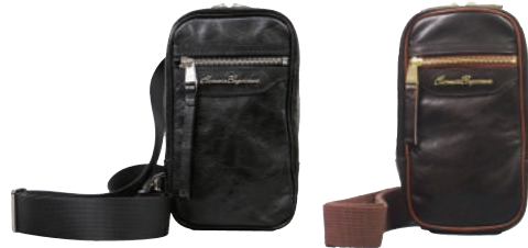
● BLACK ● BROWN