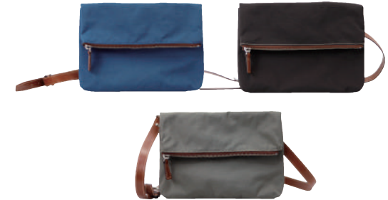
● BLUE ● KHAKI ● BLACK