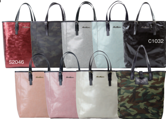
C1027 ● COLOR ASSORTED S2011