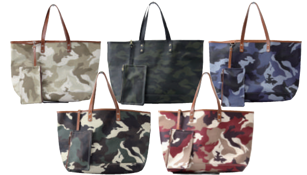
● COLOR ASSORTED