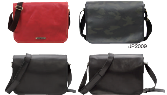
● BLACK ● CAMO