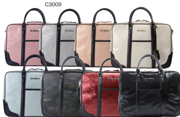
● COLOR ASSORTED

コットン生地に PVC コーティング加工を施し、防水性を高めた素材を使用しています。汚れにも強く、サッと拭くだけでメンテナンスが可能。