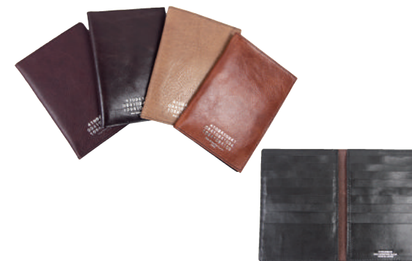
● COLOR ASSORTED