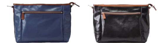
● BLUE ● BLACK