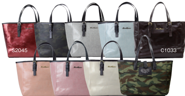
C1028 ● COLOR ASSORTED S2010