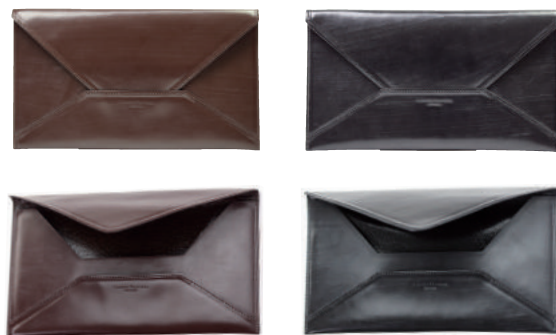
● BROWN ● BLACK