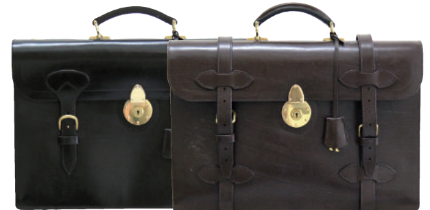
● BLACK ● BROWN