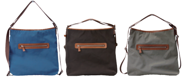
● BLUE ● BLACK ● KHAKI