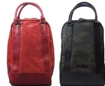
C2027 JP2010 ● RED ● CAMO