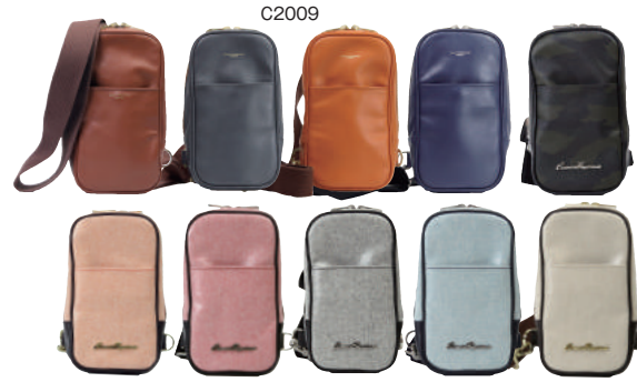
● COLOR ASSORTED