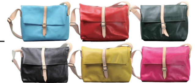
● COLOR ASSORTED