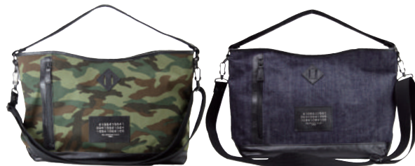
● CAMO ● BLUE