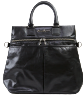
● BLACK ● BLOWN