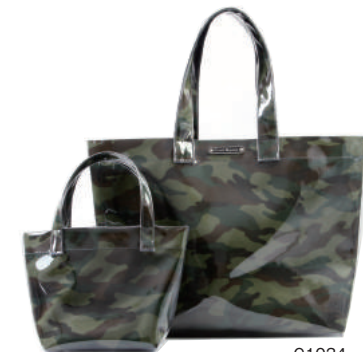
C1034 ● CAMO C1034

コットン生地にPVCコーティング加工を施し、防水性を高めた素材を使用しています。汚れにも強く、サッと拭くだけでメンテナンスが可能。