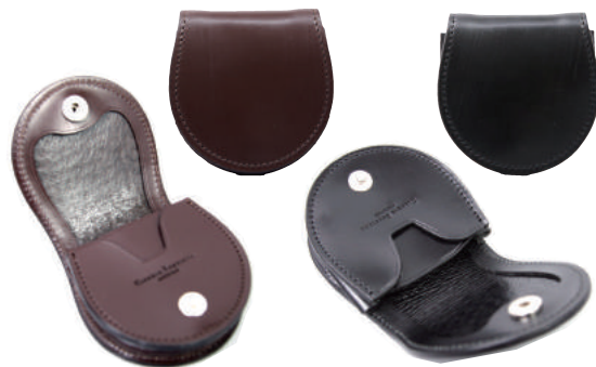
● BROWN ● BLACK