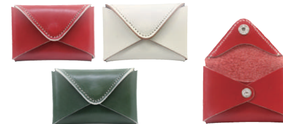
● RED ● GREEN ○ WHITE