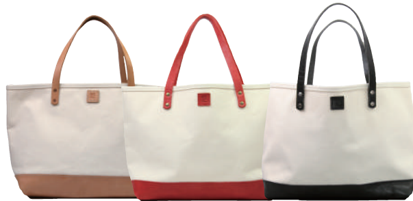
● BROWN ● RED ● BLACK

しっかりとした厚目の6号帆布を使用した、シンプルトートバッグ。付属革に牛革を使用しアクセントにしています。