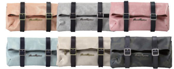
● COLOR ASSORTED

コットン生地に PVC コーティング加工を施し、防水性を高めた素材を使用しています。汚れにも強く、サッと拭くだけでメンテナンスが可能。