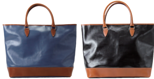
● BLUE ● BLACK