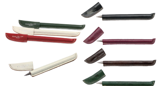
● COLOR ASSORTED