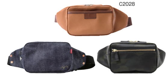
S2028 JP2008 ● BLUE ● CAMO