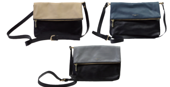
● COLOR ASSORTED