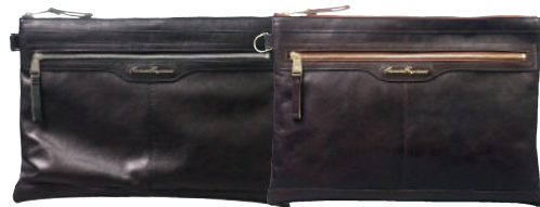
● BLACK ● BROWN

ITEM NO. DM3001 SIZE 約36×25×2cm MATERIAL 本体：山羊革 付属：牛革 PRICE ¥20,000 (税抜)