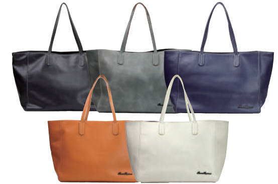
● COLOR ASSORTED